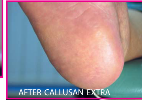
AFTER CALLUSAN EXTRA