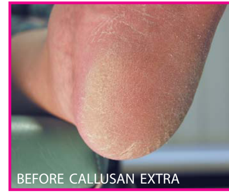
BEFORE CALLUSAN EXTRA