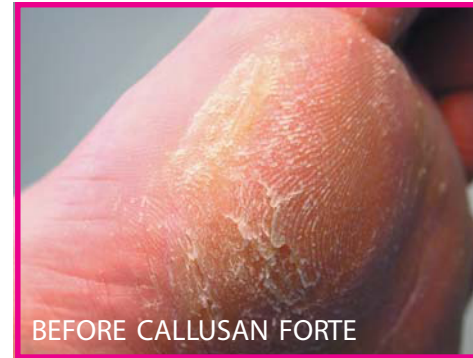
BEFORE CALLUSAN FORTE