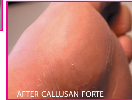
AFTER CALLUSAN FORTE